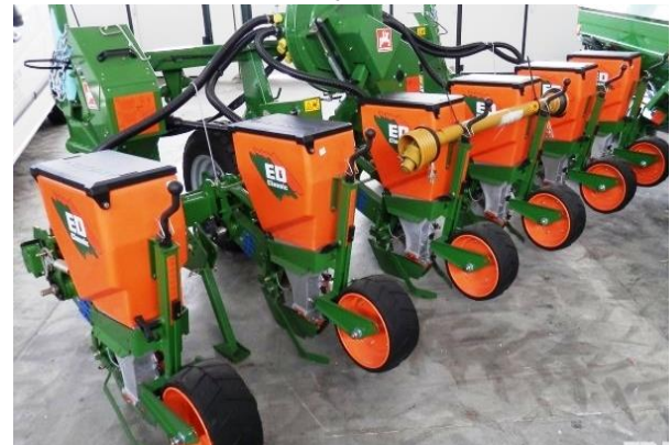
г – Amazone ED