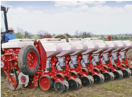
в – VEGA 8 PROFİ