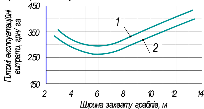
Рис. 2. Графіки залежності питомих експлуатаційних витрат на згрібанні сіна від ширини захвату граблів при довжині гонів: 1- 400, 2-1000 м

Пояснити це можливо тим, що при малій ширині захвату граблів вони мають малу продуктивність (див. табл.3), що призводить до відносно високих експлуатаційних витрат. Зростання питомих експлуатаційних витрат при ширині захвату більше 6 м пов'язане із збільшенням вартості граблів.